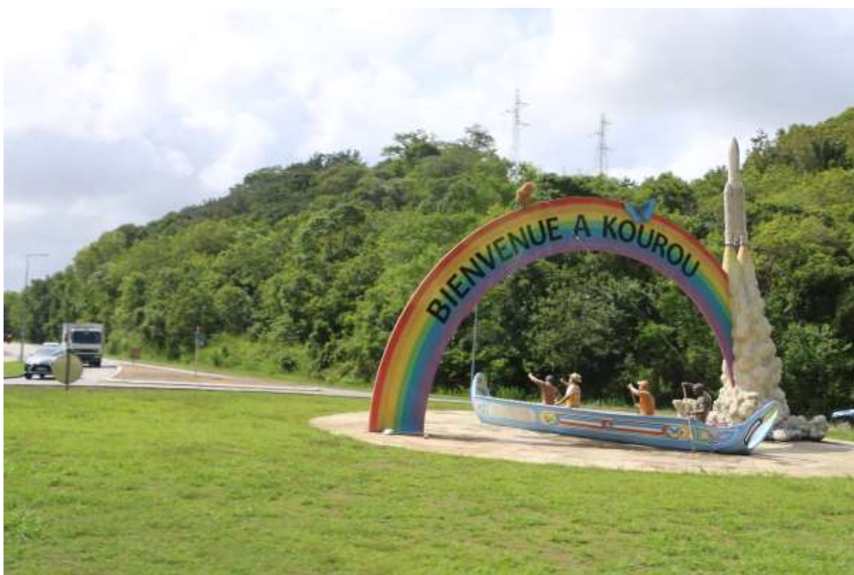
Un choc ? Guyane, 2019

Repenser et Gérer l'Altérité pour Refonder la Démocratie et les Solidarités