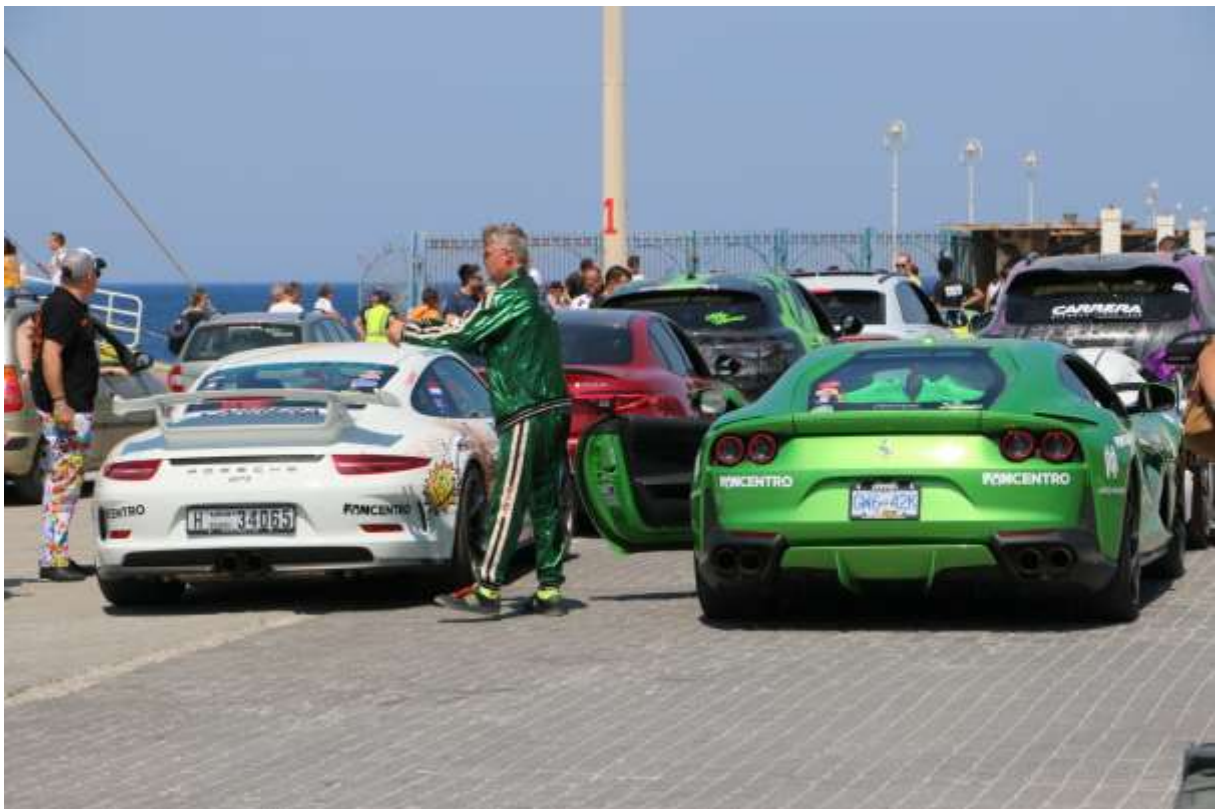
Les habits d'un certain monde « nouveau » (Mykonos 2019)

Repenser et Gérer l'Altérité pour Refonder la Démocratie et les Solidarités